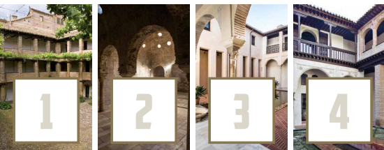
Corral del Carbón El Bañuelo Casa de Zafra Casa Morisca Hornos de Oro

LOS OBSEQUIOS SE ENTREGARÁN ENTRE LOS DÍAS 15 Y 21 DE NOVIEMBRE, HASTA AGOTAR EXISTENCIAS Hazte Amigo de las Tiendas-Librería de la Alhambra y consigue descuentos en todas tus compras (5% en libros y 10% en producto) además de ser el primero en conocer todas nuestras actividades.