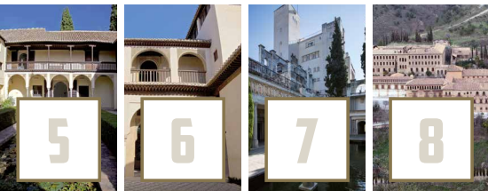
Casa del Chapiz Palacio de Dar al-Horra Fundación Rodríguez-Acosta Abadía del Sacromonte