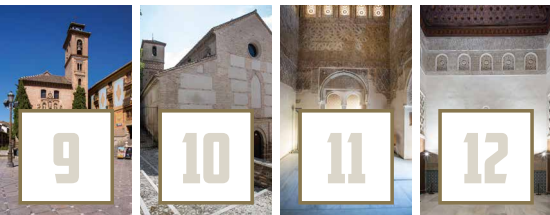
Iglesia San Gil y Santa Ana Iglesia San Juan de los Reyes Alcázar del Genil Cuarto Real de Santo Domingo